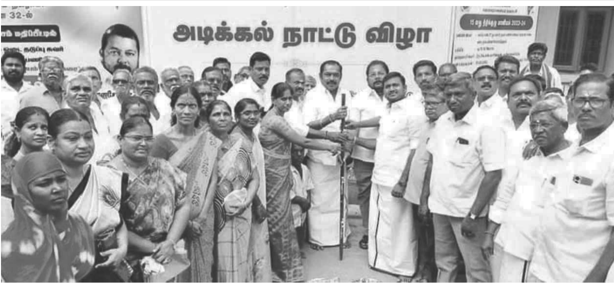
அடிக்கல் நாட்டு விழா

குமாரபாளையம், பிப். 15- குமாரபாளையத்தில் ரூ.76.50 லட்சம் மதிப்பீட்டில் நலத்திட்ட பணிகளுக்கு அடிக்கல் நாட்டு விழா நடைபெற்றது.